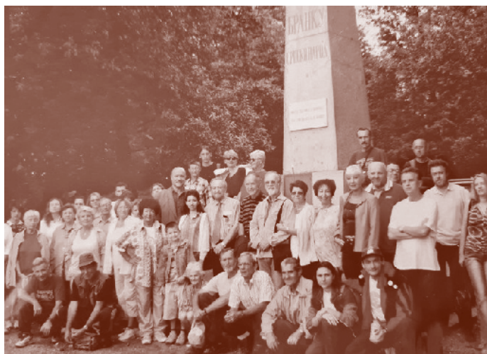
Песници, уметници и јублика на Стражилову, пored Бранковог гроба, 2003.

Вест из недељника „Џон Бул“, Лондон, субота, 4. август 1883. године, пронађена истраживањем Милене Грујичић, у њеном преводу с енглеског језика: „Ове недеље, земни остаци најпопуларнијег српског песника уклоњени су са гробља Св. Марка у Бечу и пребачени на Стражилово, близу Карловаца, које је песник одабрао за место свога починка. Бранко Радичевић, или само – Бранко, како је обично у народу називан, рођен је у Броду 1824. године. Он је имао највећи утицај на књижевни развој српске нације. Бранко се може назвати и зачетником модерне српске књижевности. Као лирски песник, он се, можда, најбоље може описати као српски Бернс, и као такав, српски песник par excellence . Бранкова највећа амбиција – да посети фатално Косово Поље и напише еп о тамошњој бици – спречена је његовом прераном смрћу 1853. године.“